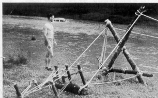
La foto de la izquierda muestra la forma cuidadosa en que se sujetaron las sogas. La foto de abajo da detalles de los palos que formaban el extremo del puente. El mapa muestra la ubicación del puente.

Tomando su gran linterna, se deslizó fuera de la bolsa de dormir. Abrió la lona que cubría la entrada y a la luz de la linterna se ofreció ante su vista un espectáculo aterrador. A poco menos de 15 metros de la tienda pasaba un torrente de agua barrosa que arrastraba troncos y ramas de árboles que avanzaban entrecuchándose unos contra otros. Restregándose los ojos comprobó que no se trataba de una pesadilla. ¡Todo era muy real! Y entonces se percató de la horrible verdad.