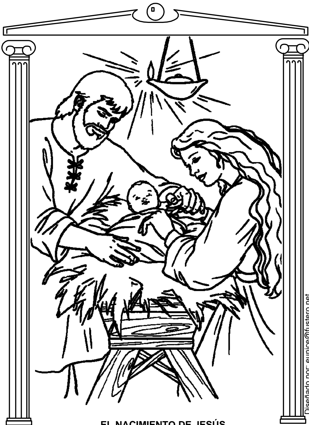
EL NACIMIENTO DE JESÚS