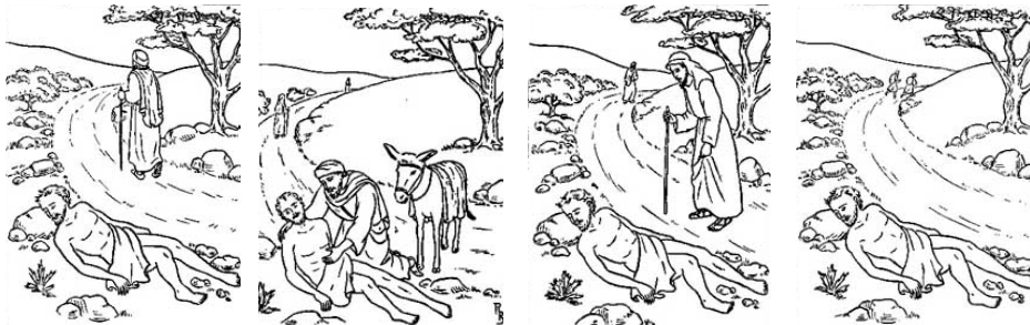
Ordena las escenas