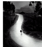
Y lumbrera a mi camino.