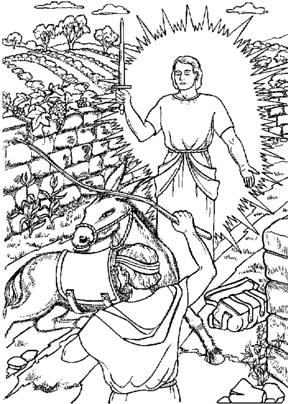
BALAAM Números 22