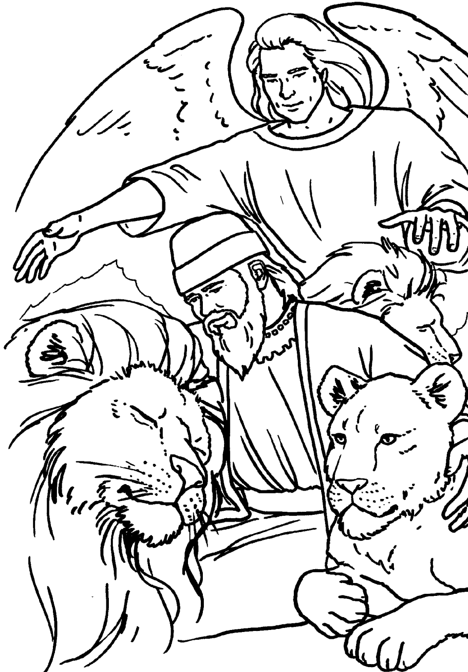
DANIEL EN EL FOSO DE LOS LEONES