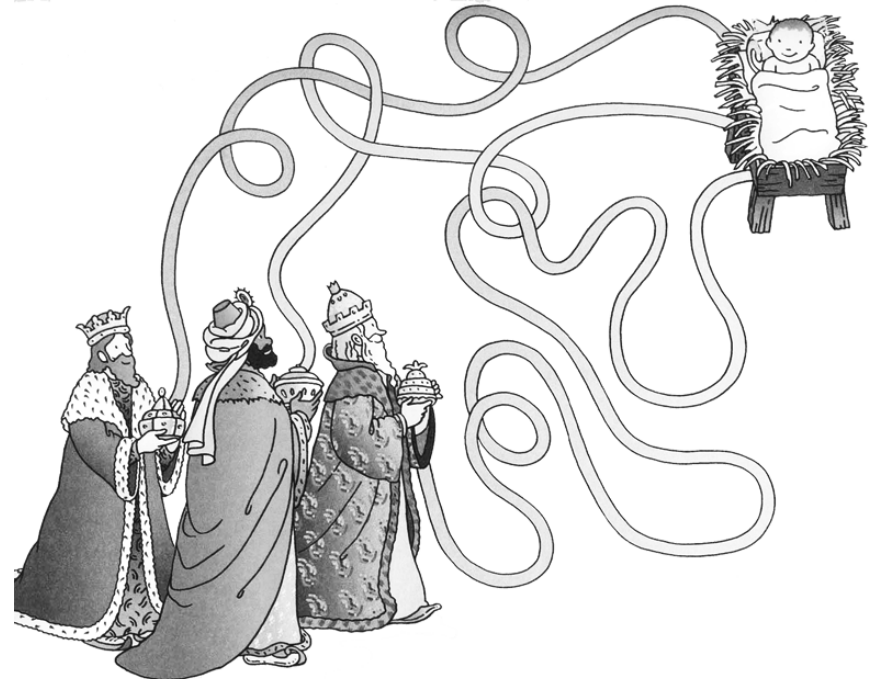
Con una línea une a los Reyes magos con el Niño Jesús