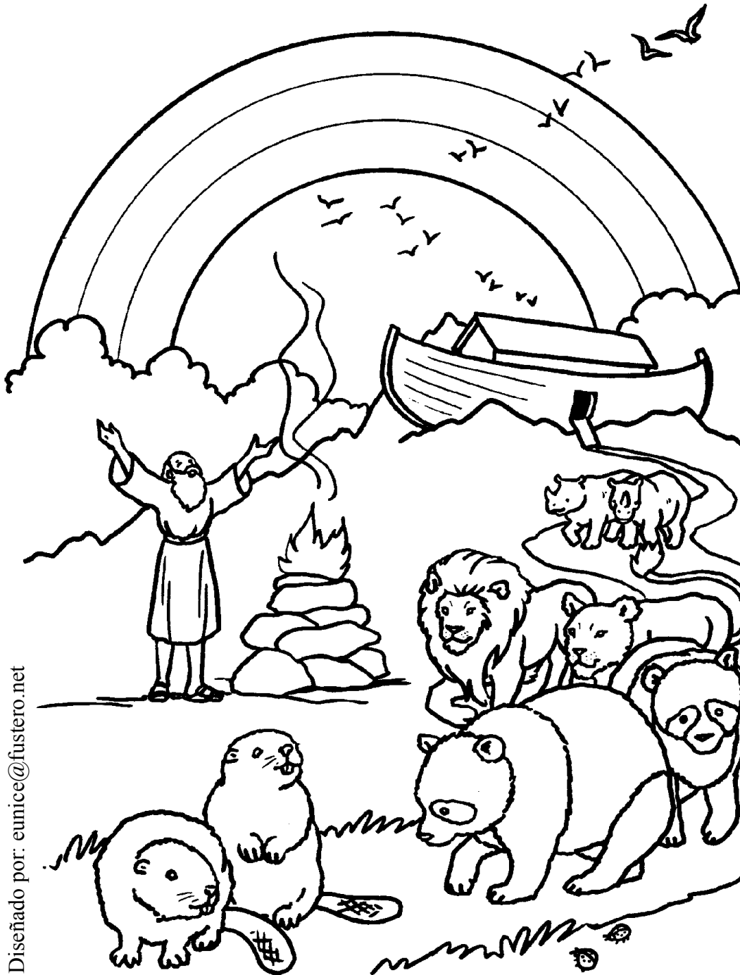
NOÉ SALE DEL ARCA